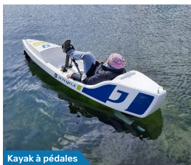
Kayak à pédales