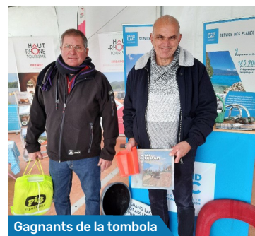
Gagnants de la tombola