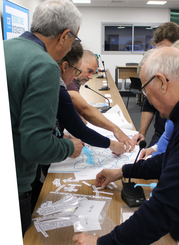
Première rencontre de l'Atelier citoyens le 6 avril 2023