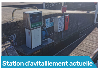
Station d'avitaillement actuelle