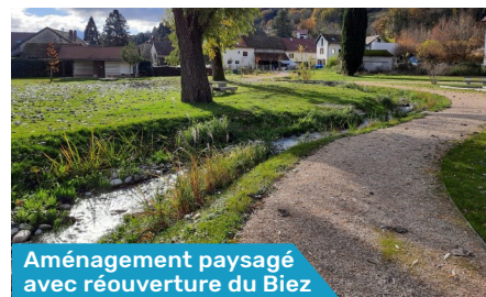
Aménagement paysagé avec réouverture du Biez