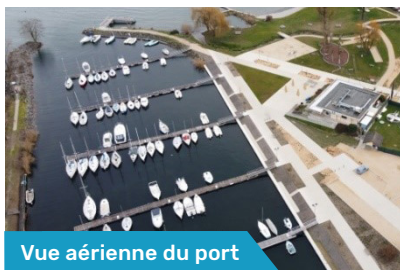
Vue aérienne du port

La construction de la capitainerie va démarrer ce printemps mais ce chantier n'impactera pas le fonctionnement du port ni de la mise à l'eau.