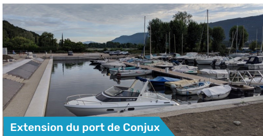
Extension du port de Conjux