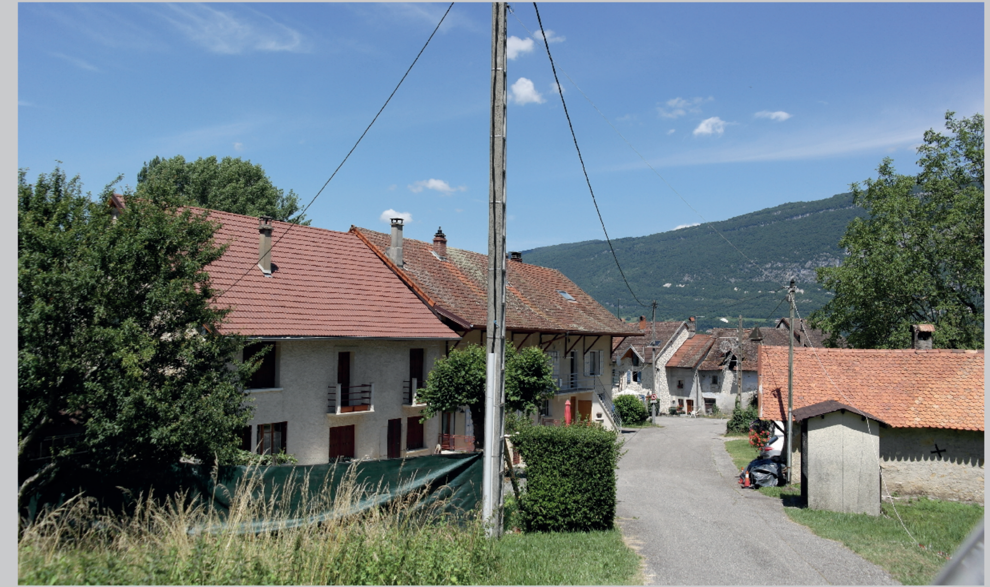
Homogénéité des teintes de toits et mitoyenneté des constructions avec décroché de volume.