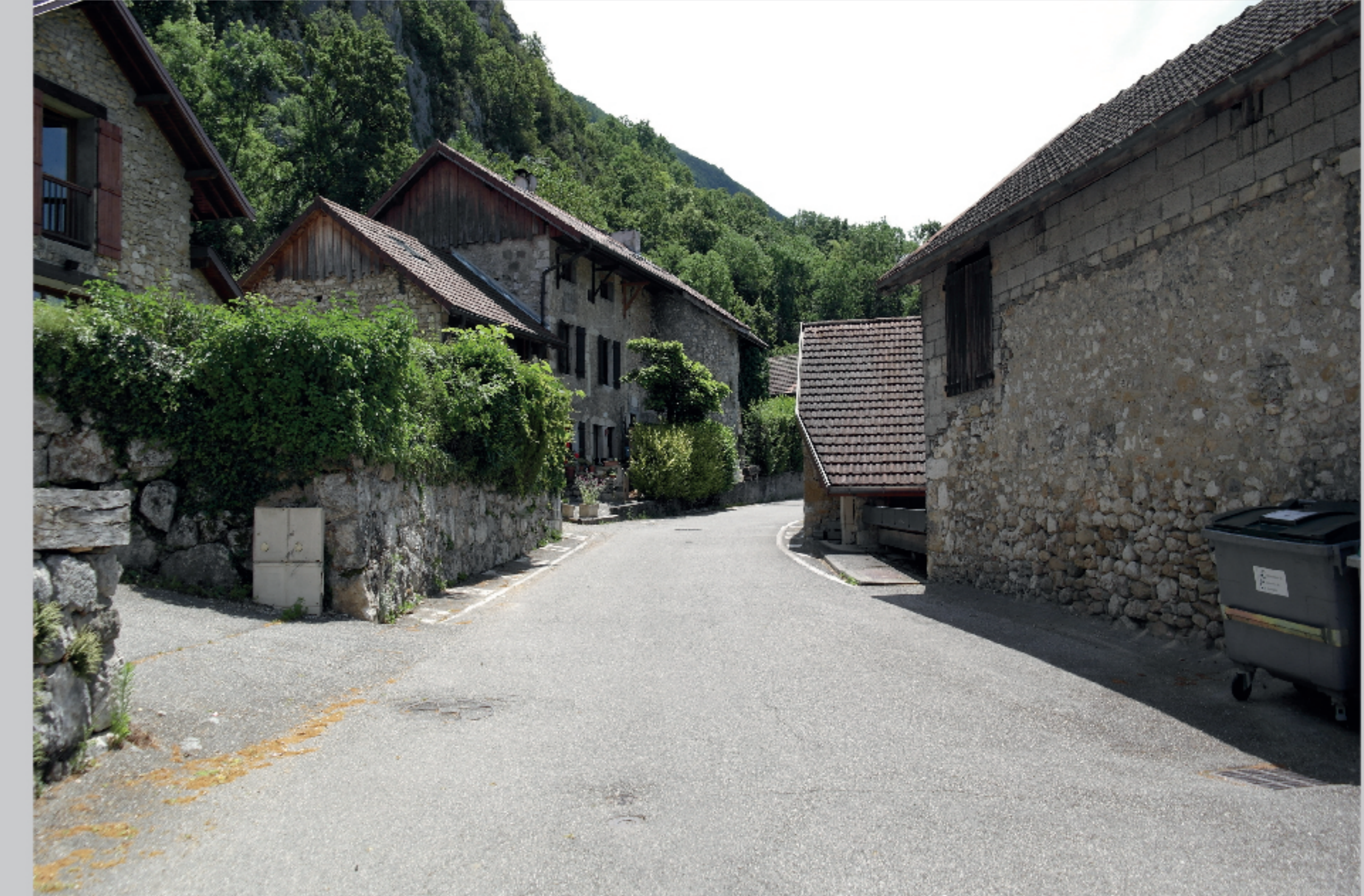
Pierre de taille et enduits maçonnés de teinte claire ou pastel et décrochés entre les constructions mitoyennes. Alignement strict à la rue dans les noyaux anciens avec décroché dans les volume rompant la monotonie de l'alignement et le caractère mitoyen des constructions.