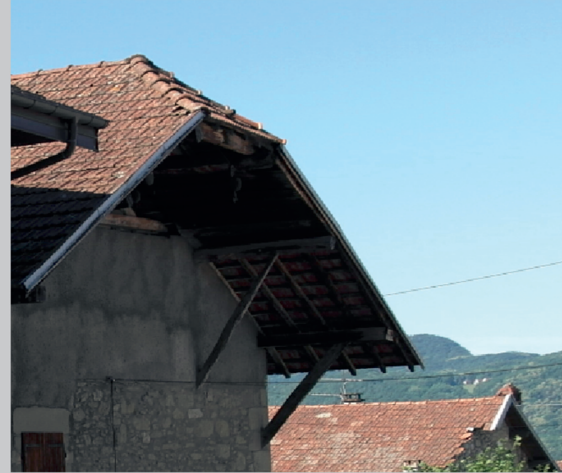
Les débords de toitures sont la norme